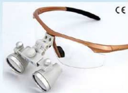
CH 型ルーペ(本体が白色)

CM 型、CH 型共に 2.5 倍、3.0 倍、3.5 倍、4.0 倍が有ります。