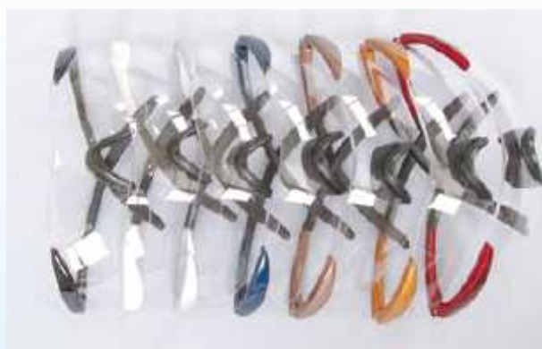
形式番号; FTP+色 プラスチック・スポーツタイプ フレーム 色; 黒、シルバー、白、藍、茶、ゴールド、赤