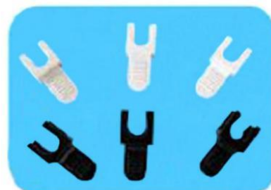
フリップアップレバー