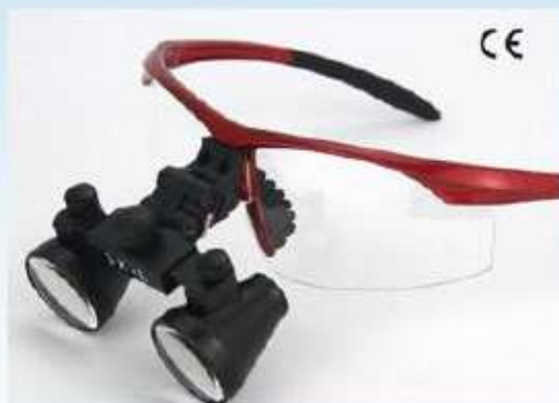
CM 型ルーペ(本体が黒色)

多くの方に使用されている標準的なタイプで、非常に軽く、瞳孔間調整も簡便に行えます。