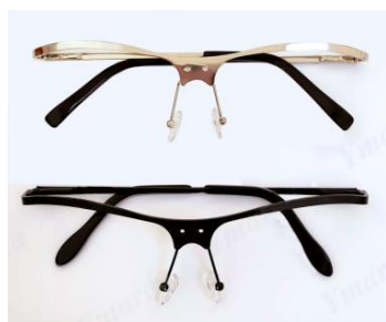
形式番号: * * * * * ハーフメタルフレーム 色: 黒、銀