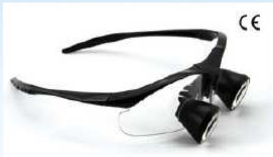
TTL(埋め込み)型ルーペ