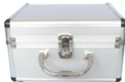
ヘッドバンド用金属ケース