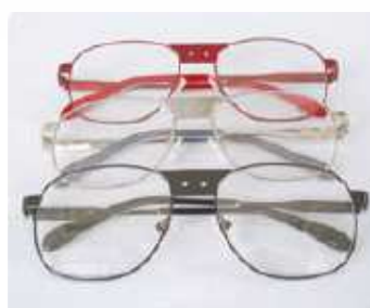
形式番号; FM+色 金属 フレーム 色; 黒、シルバー、ワインレッド