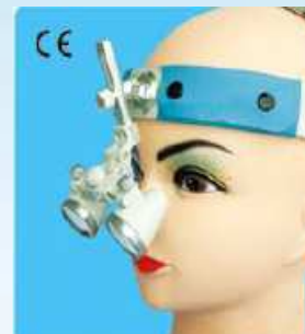
ヘッドバンド CH ルーペ