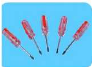
調整用ドライバー