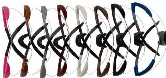
形式番号: FTP+色 TPスポーツタイプ フレーム 色: 黒、銀、白、青、茶、金、赤