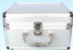
ヘッドバンド用金属ケース