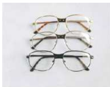
形式番号; FT+色 チタニウム フレーム 色; 黒、シルバー