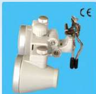
クリップ・オン CH ルーペ