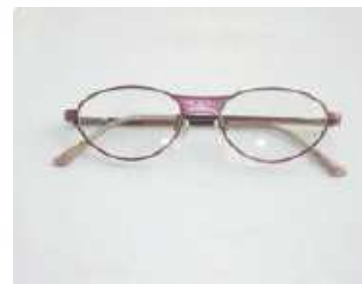
形式番号; FLM+色 金属 フレーム(女性用) 色; 紫