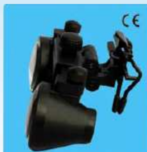
クリップ・オン CM ルーペ