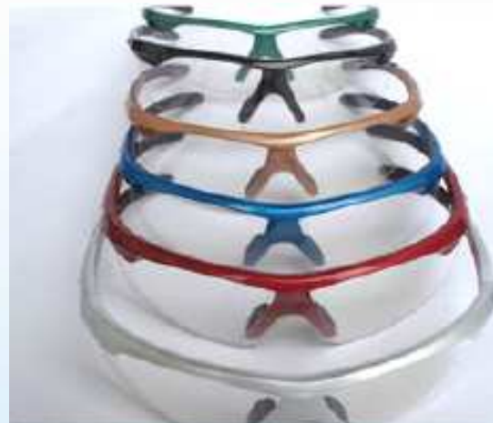
形式番号; FBP+色 プラスチック・スポーツタイプ フレーム 色; 黒、シルバー、白、緑、青、赤、ゴールド