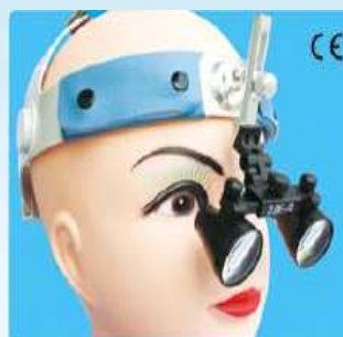
ヘッドバンド CM ルーペ