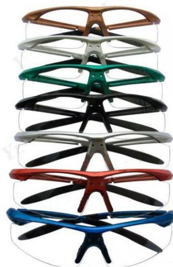
形式番号: FBP+色 BPスポーツタイプ フレーム 色: 黒、銀、白、青、緑、金、赤